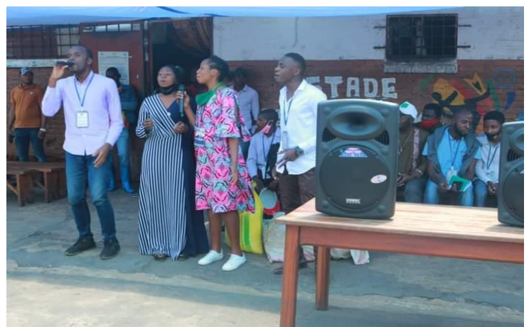
Exécution des chants de réconfort