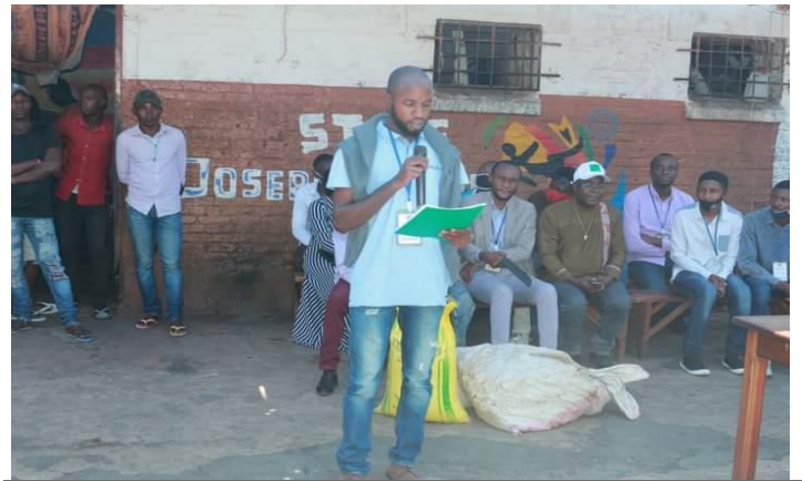
Présentation du message de réconfort et de solidarité aux détenus