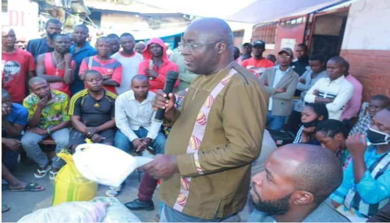
Echange avec les jeunes de Bunyakiri détenus à la prison centrale