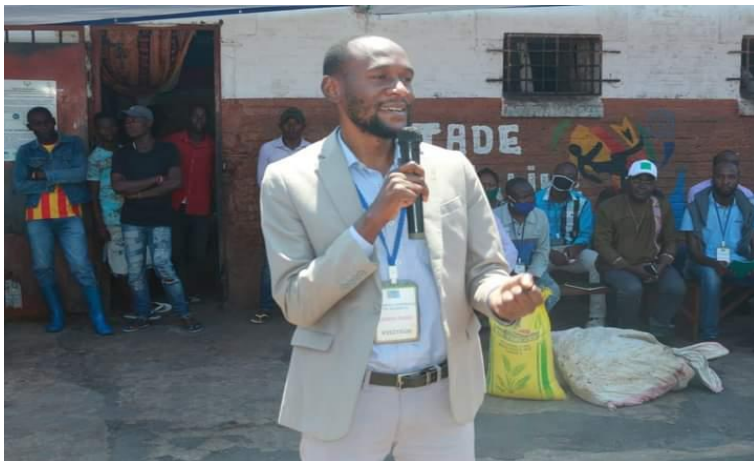
Présentation de la plate-forme Youth for Peace DRC